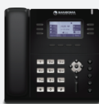
s400 / s405*